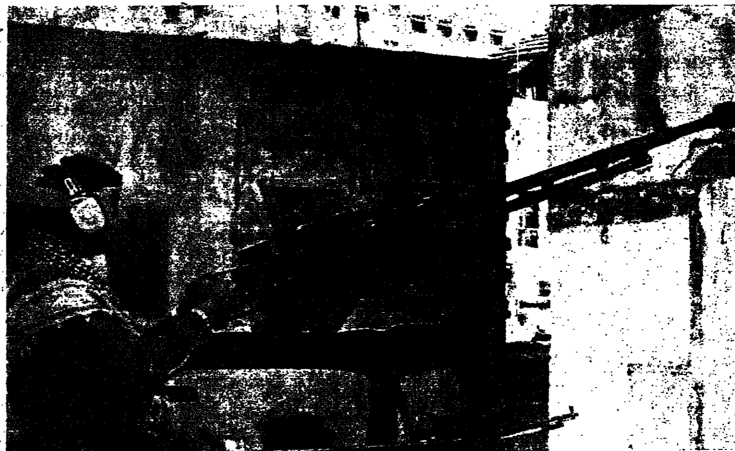
■ مقاتل وراء رشاش ثقيل

بيروت لم تهدأ ولم تنعم . تلاصصا والتذالك لا تفرق بين ليل ونهار . وتكاد سماء العاصمة لا تخار في اية لحظة من رسامس او ثقبة . وكما بيروت ، كذلك الناس .. لا راحة في الليل والنهار . والقسمة المشتركة بين الجميع هو الربيع والقلق وعدم النوم .